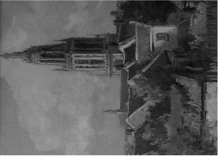
J. le Blanc, olieverfschilderij afm. 39x48 cm (coll. A.J. de Jong)