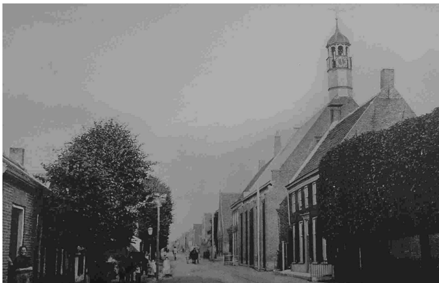
Rijksstraatweg te Elst, rechts de N.H. kerk waar Ds. A. v.d. Brandhof 20 jaar gestaan heeft

‘Boeroes kon makandra’ (boeren voor elkaar). Deze blanke kolonisten en hun nakomelingen worden in Suriname wel ‘boeroes’ genoemd. Zij hebben op internet een eigen website en zij organiseren jaarlijks tenminste één bijeenkomst in Nederland.